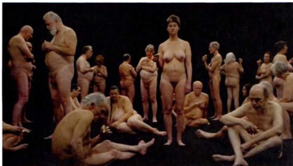
Guido van der Werve Nummer zestien, the present moment

Stond zijn werk altijd in het teken van de toekomst en de hoop, in Nummer zestien, the present moment trekt Guido van der Werve een neerslachtige conclusie. In zijn meest existentiële film ooit sombert hij over het lot van de mensheid die zich onmachtig toont tegenover de problemen die de samenleving van vandaag opwerpt.