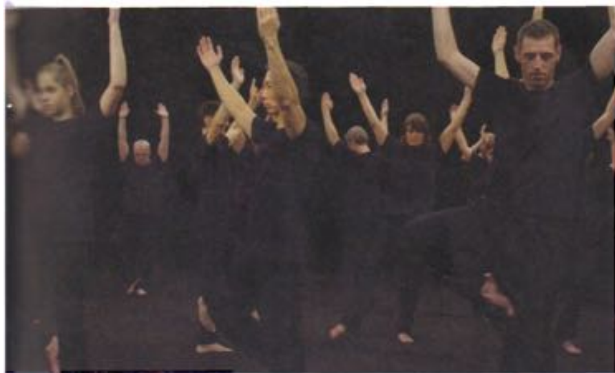
Guido van der Werve, Nummer achten: de present moment , 2016, stilla uit 3-kanalen video-metabele met piano, duur 50 min. 30 sec.