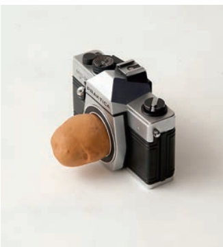
Андрей Ройтер. «Картофельная оптика», 2011 год