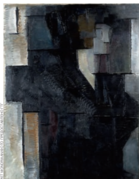
Пит Мондриан. «Портрет дамы», 1912 год