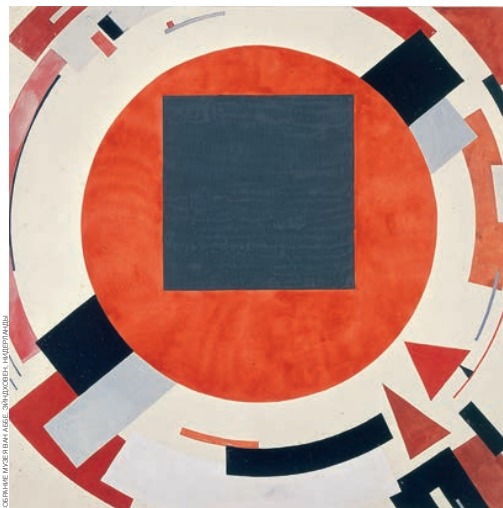
Эль Лисицкий. «Проун», около 1922–1923 годов