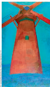
Пит Мондриан. «Остзейская мельница вечером», 1907–1908 годы