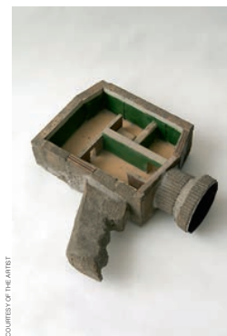
Андрей Ройтер. «Открытый дом», 2011 год