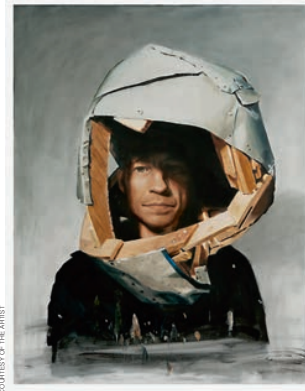
Андрей Ройтер. «Шлем», 2012 год